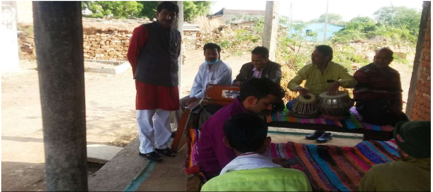
Unnamed Road, Ber Kheda, Madhya Pradesh 476229, India