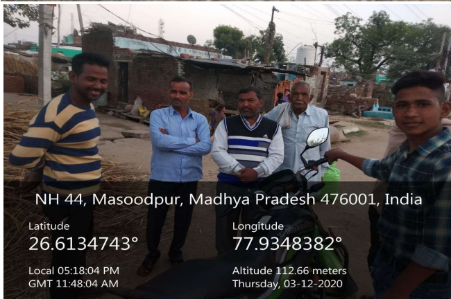
NH 44, Masoodpur, Madhya Pradesh 476001, India

Latitude 26.1740953° Longitude 77.4271029° Local 03:55:19 PM Altitude 159.7 meters GMT 10:25:19 AM Monday, 23-11-2020