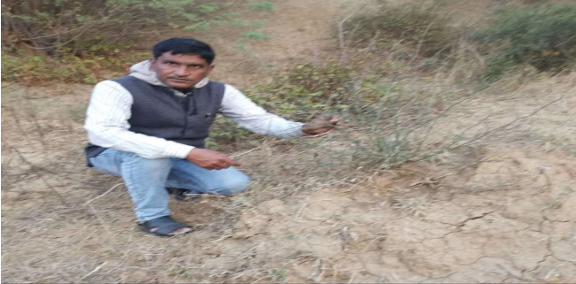
Piprai, Madhya Pradesh 476001, India

Latitude 26.6356226° Longitude 77.9378165° Local 04:53:05 PM Altitude 103.83 meters GMT 11:23:05 AM Thursday, 03-12-2020