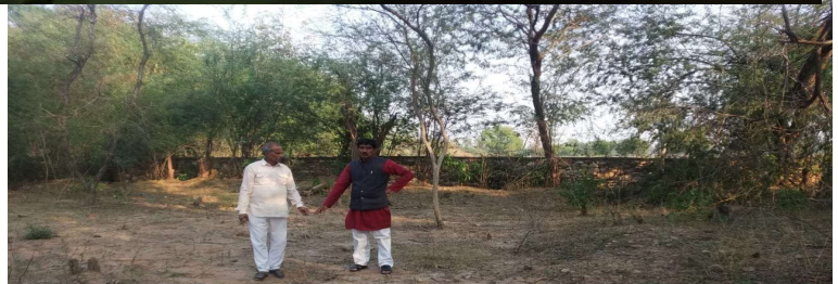
Bamsoli, Madhya Pradesh 476229, India

Latitude 26.6356226° Longitude 77.9378165° Local 04:53:05 PM Altitude 103.83 meters GMT 11:23:05 AM Thursday, 03-12-2020